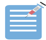
Registro de vacunación