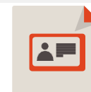
Identificación del I padre I